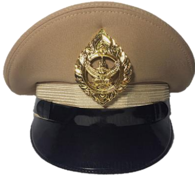
พนักงานราชการชาย