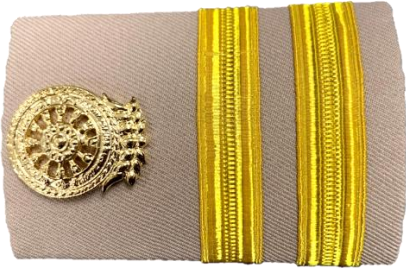
พนักงานราชการทั่วไป

ประกาศสำนักงานพระพุทธศาสนาแห่งชาติ ลงวันที่ ๑๗ มกราคม พ.ศ. ๒๕๖๖ เรื่อง การแต่งกายและเครื่องแบบปกติของพนักงานราชการในสังกัดสำนักงานพระพุทธศาสนาแห่งชาติ