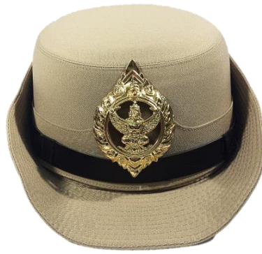
พนักงานราชการหญิง