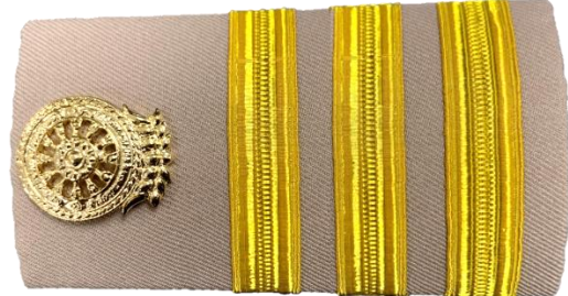
พนักงานราชการพิเศษ